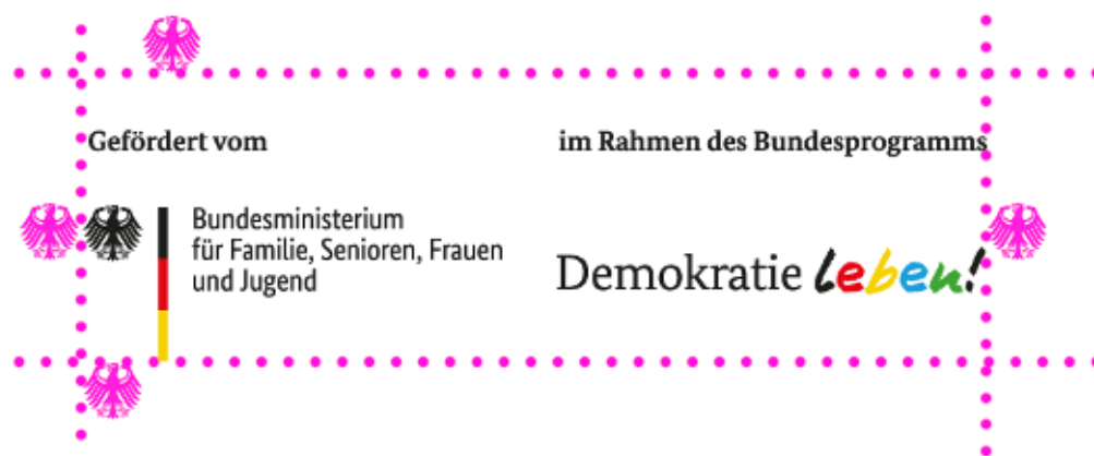
Illustration: Schutzraum um das Logo